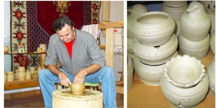
Zavičajni muzej Travnik djeluje na polju revitalizacije i aktivne zaštite elemenata nematerijalne baštine. Od 2015. godine na Starom gradu djeluje Radionica tkanja i ručne obrade tekstila, a 2016. godine pokrenuta je i Radionica tradicionalnog lončarstva.